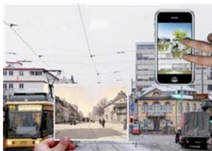
Vergangenheit, Gegenwart und Zukunft