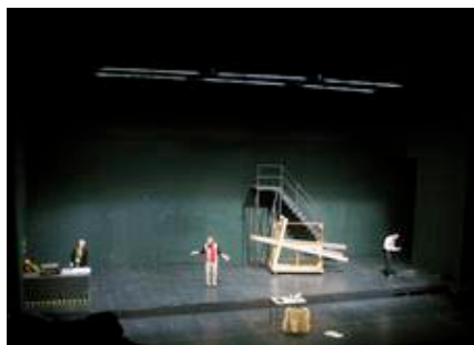
Die Goldberg-Variationen, Regie: Hermann Beil, Bad. Staatstheater Karlsruhe