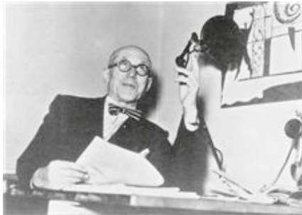
Le Corbusier in seinem Büro, im Hintergrund eine Zeichnung mit Modulor und Sechsecke

wird auch sichtbar, wie dieser mit einer neuen Art des Entwerfens seine Nachfolger bis heute beeinflusst." Laura Weissmüller, Süddeutsche Zeitung, 09.03.2010