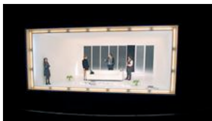
Der Gott des Gemetzels, Regie: Siegfried Bühr, Schauspielhaus Kiel