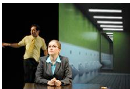
Alles, Regie: Rafael Spregelburd,