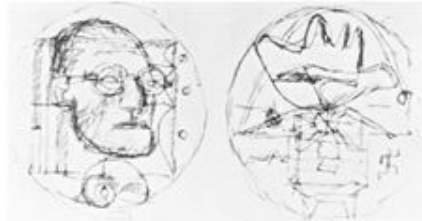
Le Corbusier, Skizze für eine Gedenkmedaille zu Ehren Le Corbusiers, 18. Juni 1950