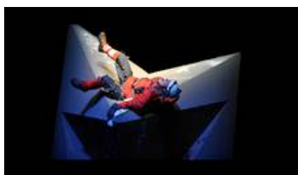
Der Berg über den kein Vogel fliegt, Regie: Knut Weber, Bad. Staatstheater Karlsruhe