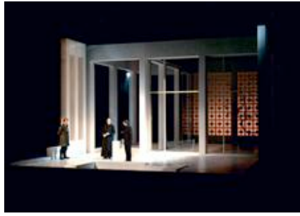
Nathan der Weise, Regie: Siegfried Bühler, Theater Krefeld/Mönchengladbach