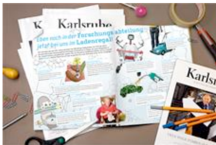
Caption goes here