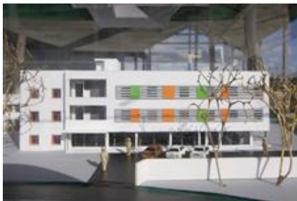
Model des Gesundheitsministerium in Süd Dschuba