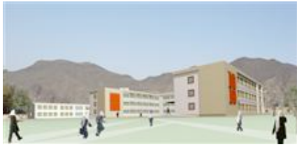
Sardar-e-Kabuli Schule für UNOPS in Kabul, Afghanistan