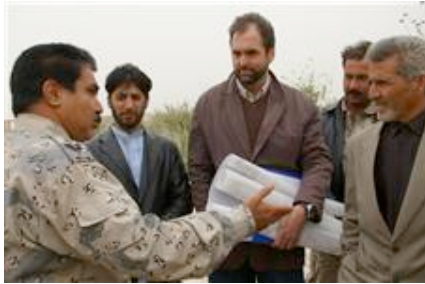
Besichtigung der Grenze Afghanistans nördlich von Kunduz. Dort soll eine Grenzposten und Zollgebäude gebaut werden.