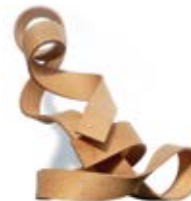
Ausstellung: „green innovations – Hightech in Holz“ by spek Design