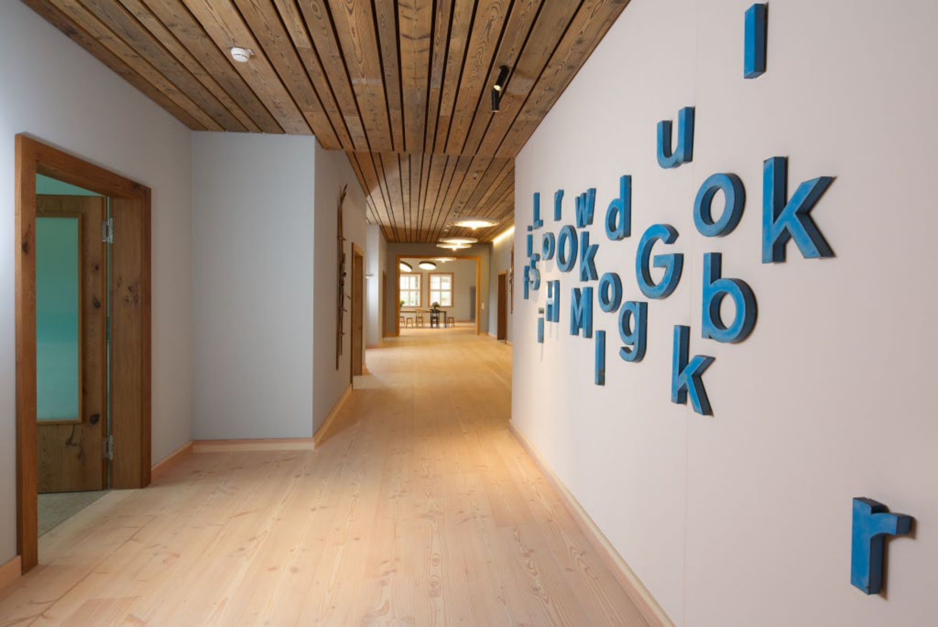
Flur mit viel Platz für den Bewegungsdrang im Rollstuhl.