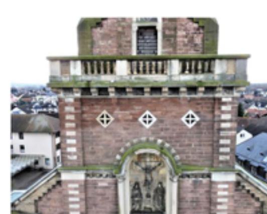
Arbeitsbereich Balustrade mit Kreuzigungsgruppe, Nordfassade