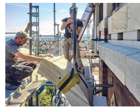
Einbau der neuen Bogenwerkstücke