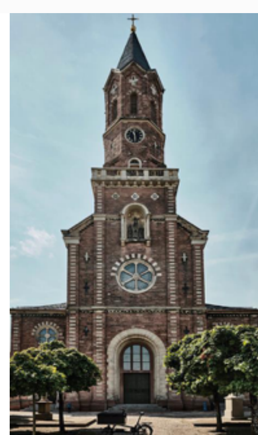
Katholische Kirche Bietigheim, Nordfassade mit Turm