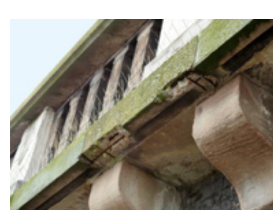
Betonergänzung der Balustradenplatte