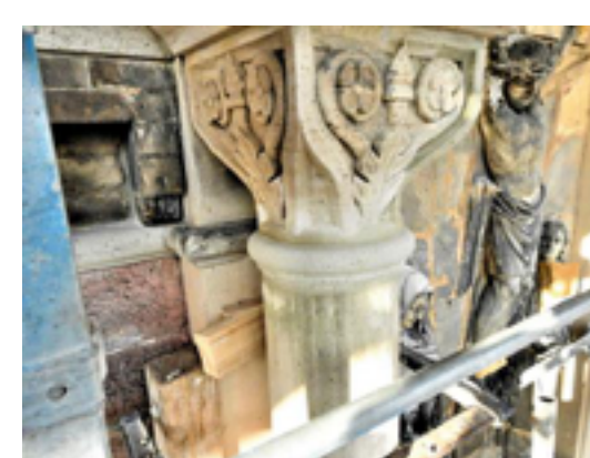
Profilierte Vierung im unteren Bereich des Kapitels