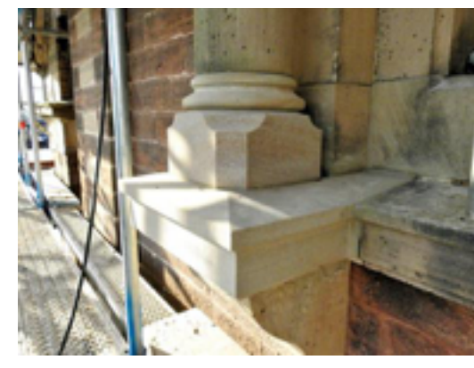
Vierungen und Werkstücke im Bereich der Säulen Basis